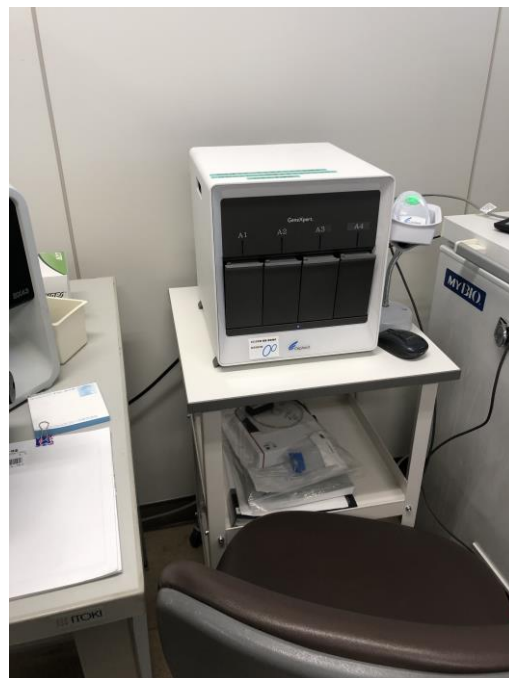
全自動遺伝子解析装置（PCR検査装置）配置