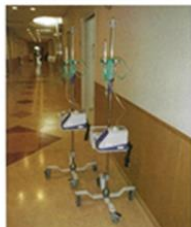
人工呼吸器「ネーザルハイフロー」