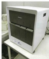
全自動遺伝子解析装置（PCR検査装置）

古河赤十字病院はこのほど人工呼吸器及び全自動遺伝子解析装置（PCR検査装置）を令和4年度公益財団法人JKA補助事業（申請中）にて、上記の機器整備を行いました。