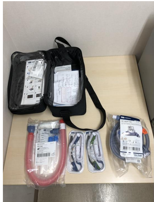
人工呼吸器（ネーザルハイフロー）付属品