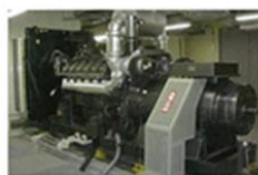
非常用発電機（上階に設置）