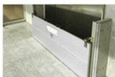
止水板の設置の様様

（※2）非常用発電機とは、予期せぬ事故や災害が発生し、建物内への電力供給がストップしてしまった場合に稼働して電力供給を行うものです。