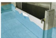
止水板の効果（イメージ）