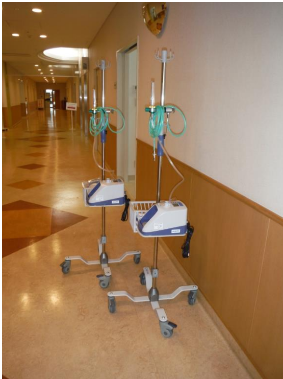
人工呼吸器（ネーザルハイフロー）本体