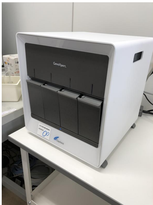
全自動遺伝子解析装置（PCR検査装置）