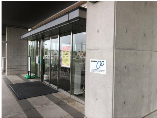
古河赤十字病院正面玄関

GeneXpertシステムは検体から核酸を抽出し精製、増幅、検出および結果報告までを全自動で行う遺伝子検査システムです。本体はモジュールと呼ばれる構成単位ごとに一つのシステムと機能し測定においてはモジュールごとに制御可能です。また簡便な前処理による迅速遺伝子検査が実施でき、一般的なPCR検査装置より約60分以上の時間短縮が図れます。